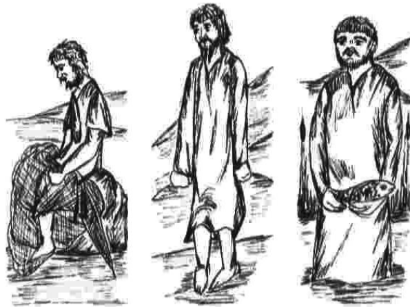
Andreas. Filippus. Bartolomeüs.